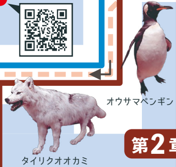
オウサマペンギン