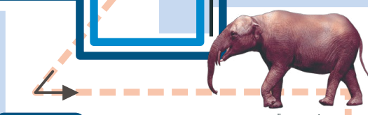
ステゴロフォドン