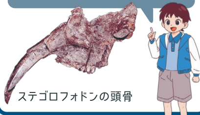
ステゴロフォドンの頭骨