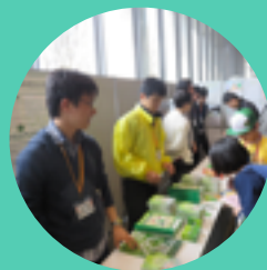
ユースのブースで景品交換

いろんな地域の人と名刺交換をしてもらい、 日本を6ブロックに分けたうち 4ブロック以上の仲間の名刺を集めた人には 景品をプレゼントをしました。 いろんな都道府県の人と友達になって、 おしゃべりするきっかけになったかな？