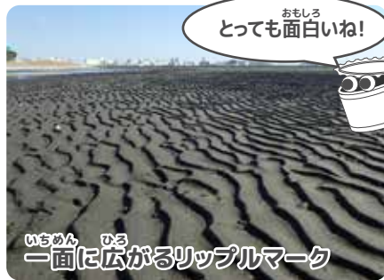
とっても面白いね!

たまに工作のワークショップを担当します。工作が好きで、最近は種本や押し花を使ってレジンストラップを作ったりしています。