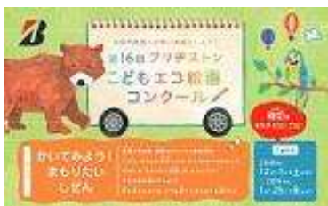
エコ絵画コンクールの告知