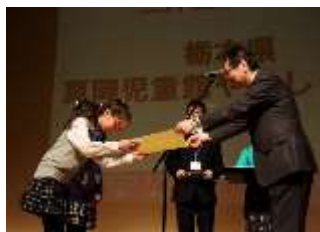
クラブの活動を表彰