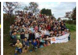
地域クラブの活動に社員参加

たくさんの企業団体の皆さまと手をたずさえて、全国各地の環境保全を担う次世代の子どもたちの育成を共に行っていければ幸いです。何卒よろしくお願いたします。