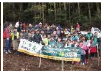
クラブとの協働企画活動