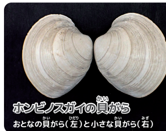
ホンビノスガイの貝がら おとなの貝がら(左)と小さな貝がら(右)

がくしゅうかん ひろ さんばんぜ ひ 学習館のすぐそばに広がる三番瀬干 潟で、まだ幼い小さなホンビノスガイの かい ひろ かがたほう おお 貝がらを拾いました。片方のからの大き さは1cmほどです。ホンビノスガイの貝 がらの特徴は、成長とともに貝がらの表面に作られる同心円状のすじ(「成長線」) がはっきりしていることと、裏側の縁に刻まれた硬貨の縁のようなギザギザ。大きくなっ ても貝がらのすじとギザギザはしっかり残っています。「千葉ブランド水産物」にもなっ ている三番瀬のホンビノスガイの貝がらを干潟で探して観察してみましょう。