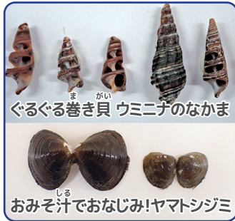
ぐるぐる巻き貝 ウミニナのなかま おみそ汁でおなじみ! ヤマトシジミ

とうきょうわん まわ ほか かいすいよくじょう ひがた いそ たの かいがん 東京湾の周りには他にも海水浴場や干潟、磯など楽しい海岸がたくさんあり ます。同じ東京湾内でも場所によって海の環境が異なり、 かいがん さまざま しゅるい かい み たと 海岸によって様々な種類の貝がらが見つかります。例えば、 かこうふきん かわ みず かいすい ま あ 河口付近では、川の水と海水が混ざり合うところにくらす ウミニナのなかまやヤマトシジミの貝がらを拾うことができ