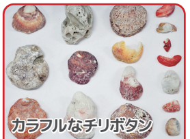
カラフルなチリボタン

とうきょうわん まわ ほか かいすいよくじょう ひがた いそ たの かいがん 東京湾の周りには他にも海水浴場や干潟、磯など楽しい海岸がたくさんあり ます。同じ東京湾内でも場所によって海の環境が異なり、 かいがん さまざま しゅるい かい み たと 海岸によって様々な種類の貝がらが見つかります。例えば、 かこうふきん かわ みず かいすい ま あ 河口付近では、川の水と海水が混ざり合うところにくらす ウミニナのなかまやヤマトシジミの貝がらを拾うことができ