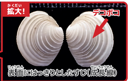
かくだい 拡大! デコボコ ひょうめん 表面にはっきりとしたすじ(成長線)