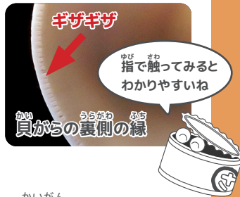
ギザギザ ゆび さお 指で触ってみると わかりやすいね かい 貝がらの裏側の縁