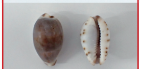
まんまるツルツル! タカラガイのなかま