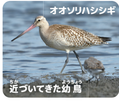
オオソリハシジギ 近づいてきた幼鳥

オオソリハシジギは三番瀬に 春と秋に渡ってくる大型のシ ギ類です。秋は幼鳥も観察 することができ、幼鳥はじつ と待っているところまで来る こともあります。(大谷)