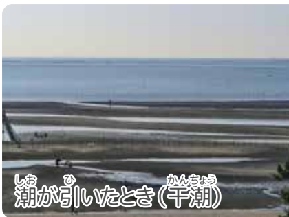
潮が引いたとき(干潮)

海には、潮が満ちたり引いたりして海面の高さが変わる“潮汐”という現象があります。最も海面が高い時を“満潮”といい、最も海面が低い時を“干潮”といいます。また、干潮時と満潮時で