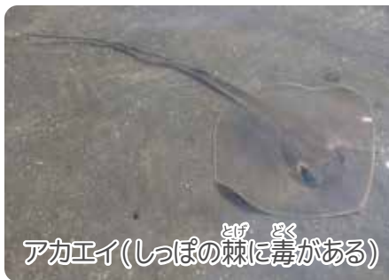
アカエイ(しっぽの棘に毒がある)

干潮・満潮は、海面の高さだけでなく時間も日によって変わってきます。潮の干満の時間は、月と太陽の影響で毎日平均50分くらいずつ遅くなっていきます。そのため潮干狩