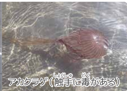
アカクラゲ(触手に毒がある)

りの開始時間が毎日変わってくるのです。風や気圧によって予測された潮位と実際の潮位が変わることもあります。予測よりも潮の引きがいい時には、早めに潮干狩りを始めることもあります。