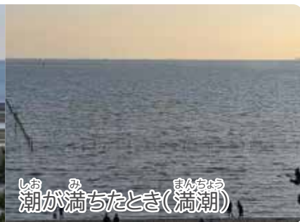
潮が満ちたとき(満潮)

変化する海面の高さ(干満差)はいつも同じというわけではなく、たくさん潮が引いたり、それほど引かなかったりします。最も干満差が大きい日を“大潮”と言い、あまり干満の差がない日を“小潮”と言います。実は、春は一年のうちで最も「昼間の干満の差が大きい」季節です。小潮のときでも、他の季節よりも大きく潮の高さが変わります。三番瀬海浜公園では、干潮時の潮位が50cm以下になることを潮干狩りの開催基準としていますが、春はこうした潮干狩りに適した日が多い季節なのです。