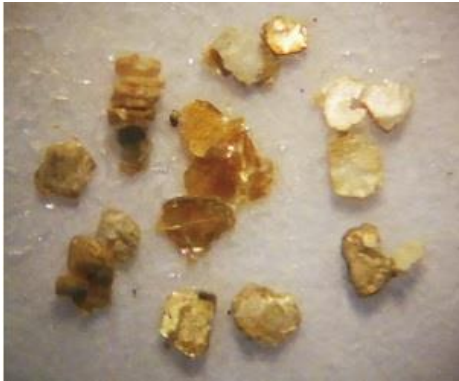
くろうんも ①黒雲母