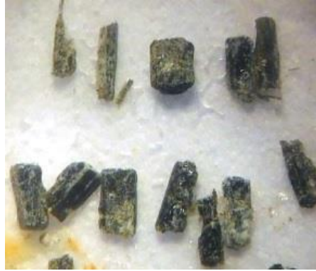
かくせんせき ②角閃石