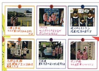
大阪府守口市 ほぼっほクラブ