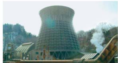
山あいでは蒸気を上げる松川地熱発電所の冷却塔(岩手県八幡平市)

日本では、地熱発電をしやすい場所の多くが国立公園や国定公園に指定されているため、むやみに開発ができません。国では、自然環境を守りながら地熱発電を行う方法について研究を始めています。