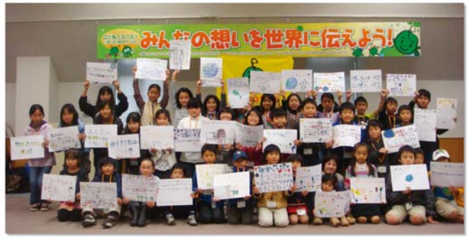
11月26日に開催されたリオ+20応援イベントで、11月26日に開催したリオ+20応援イベントで、子どもエコクラブの仲間が「地球との約束」を書きました☆ (主催：子どもエコクラブ全国事務局 協賛：東京都民銀行)

められました。この地球サミットから20年後の2012年、同じ目的の会議が、もう一度リオ・デ・ジャネイロで行われるため「リオ+20」と呼ばれています。リオ+20では、地球サミットで決められた約束が守られているか? 問題がないか? ということ、これからの地球環境を守っていくための新しい約束などを話し合います。