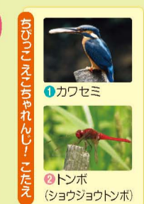
カワセミ トンボ (ショウジョウトンボ)